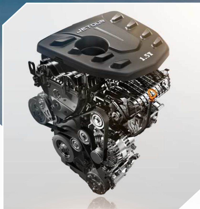
MOTOR 1.5 TURBO

La nueva Jetour X70 es una SUV muy completa. Todo esto gracias a su equipamiento con tecnología de punta y también el motor turbo que le da un gran performance en todas las rutas.