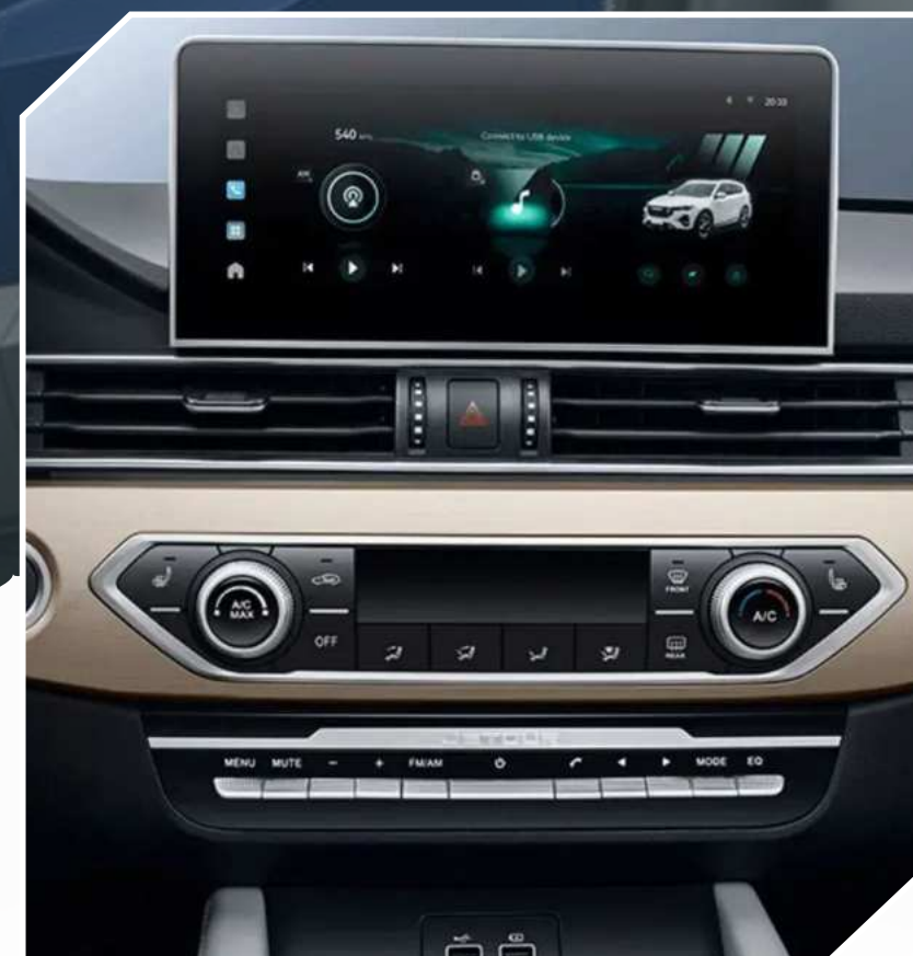
PANTALLA DE INFOENTRETENIMIENTO DE 10,1"