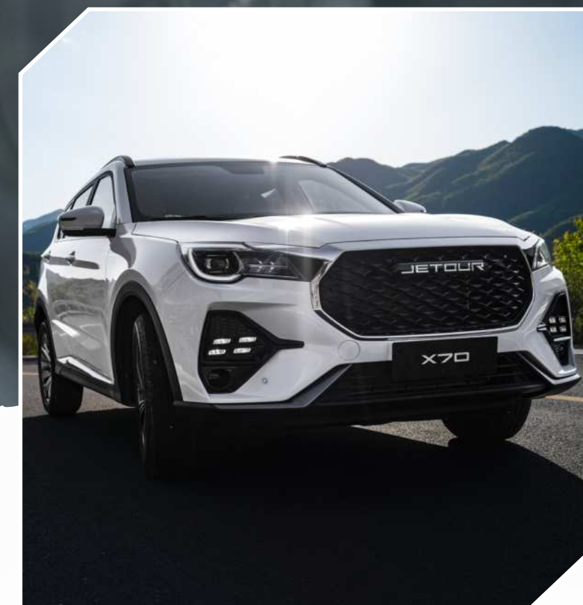
ABS + BAS + EBD + TCS + HSA + Autohold